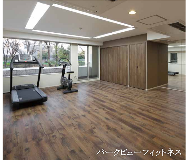
パークビューフィットネス