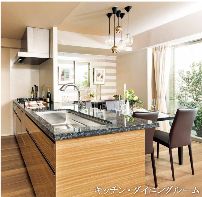
キッチン・ダイニングルーム